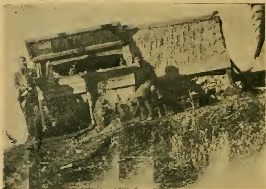
"Вилла Четырех Ветров" закончена. Строители любят свое созданием в стиле "Б а р а к о" .