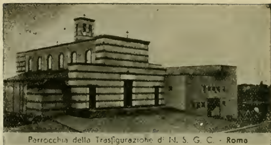
Паррокио Трасфигурационе на Монте Верде. Слева — церковь, справа — дом, где спасались русские беженцы.