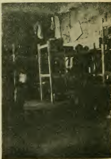
В общежитии на Виа Тассо.