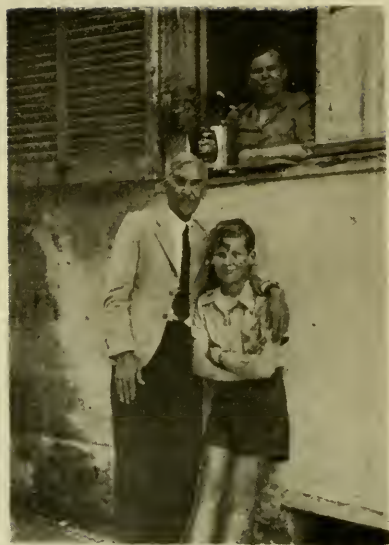
Пагани. Семья автора. Какое счастье иметь собственное окно!