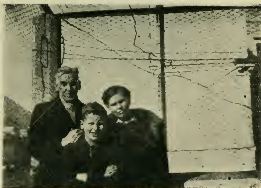
Лагерь Вилла Альба размещен в бывшем сумасшедшем доме. Решетки и традиции сохранены полностью. На верхнем снимке - крыша лагеря.