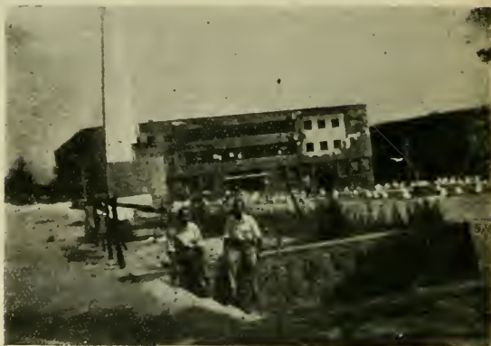
Лагерь Баньоли близ Неаполя.