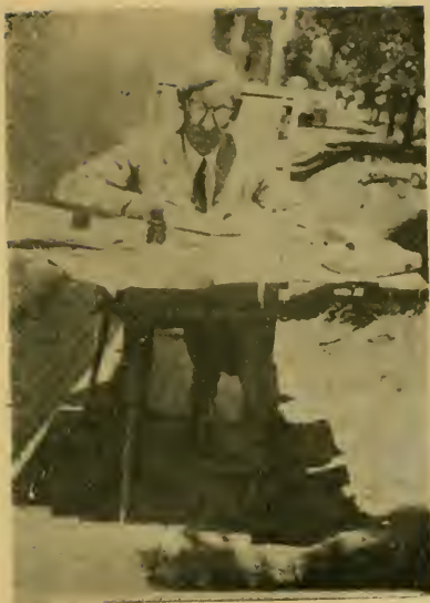
Пагани. Автор за работой над книгой. Еще тихо — 5 часов утра.